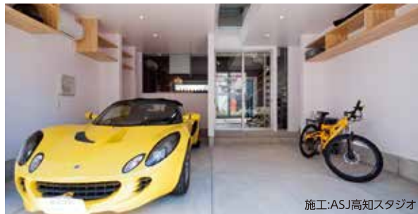
施工:ASJ高知スタジオ